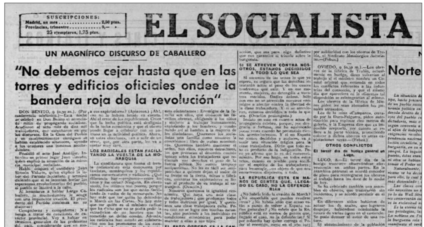
El Socialista. núm. 7634, 25 de juliol de 1933

Resolucions del Congrés del PSOE (1933). [Traduït del castellà]