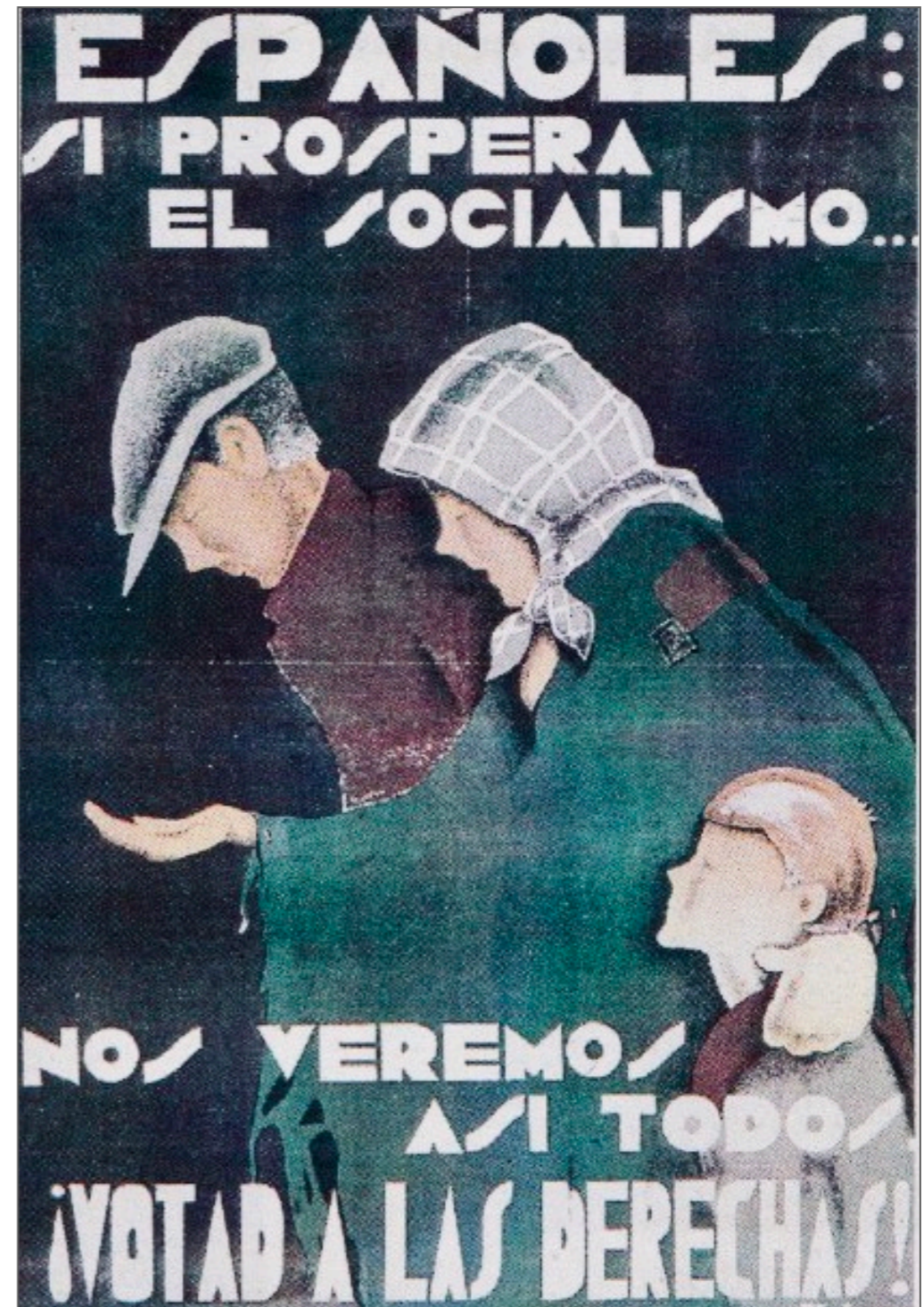
Cartell electoral de la CEDA per a les eleccions de novembre de 1933