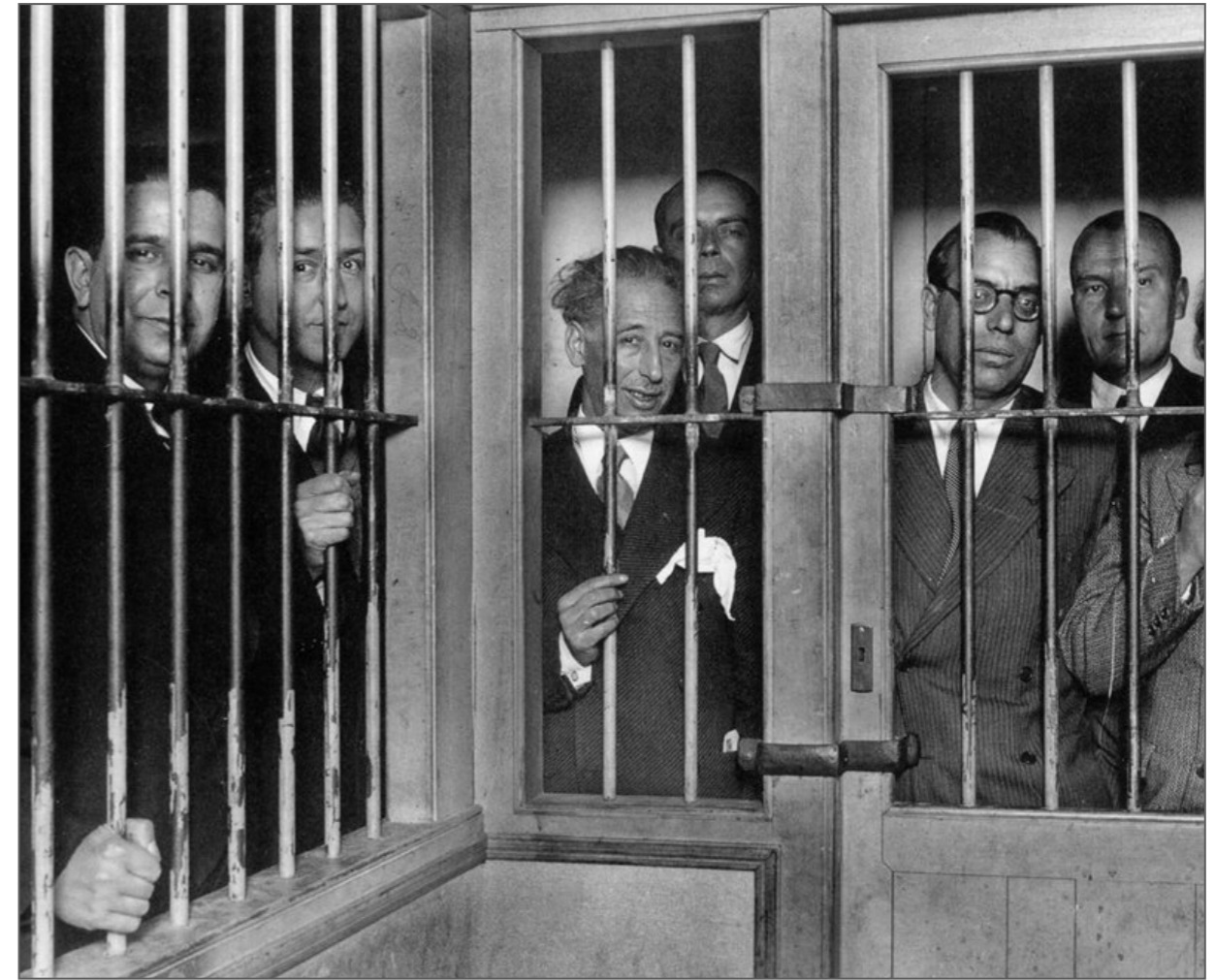
El President Lluís COMPANYS i membres de la Generalitat de Catalunya empresonats pels fets del 6 d'octubre