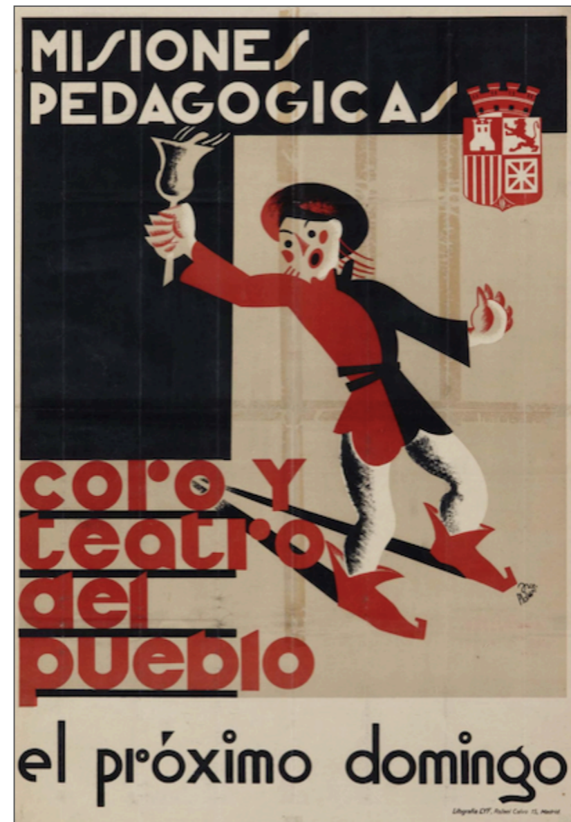
Cartell de les Missions Pedagògiques