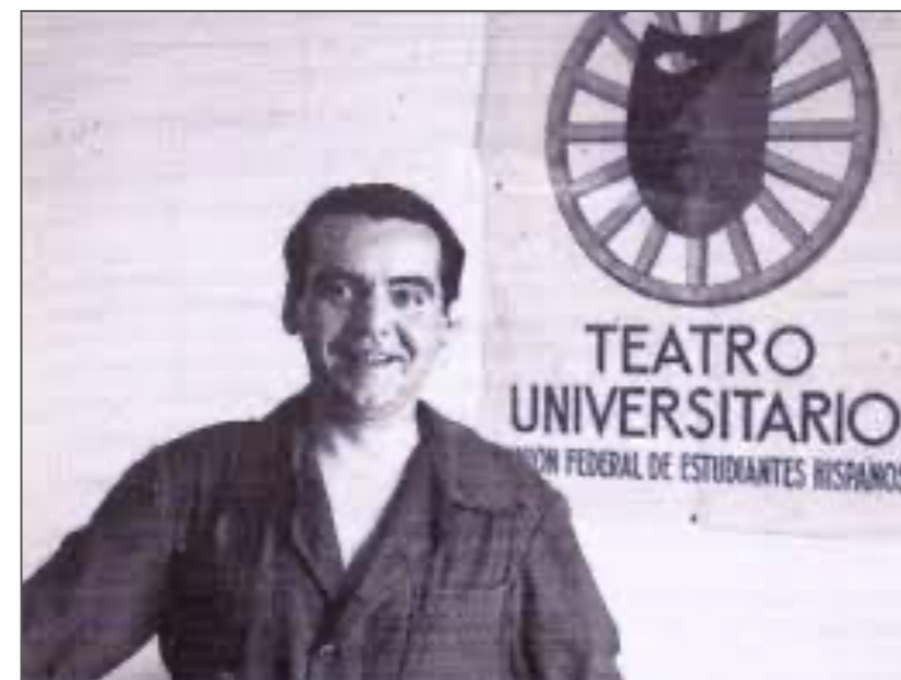
Federico GARCÍA LORCA davant un cartell de la companyia de teatre ambulants que dirigia, La Barraca