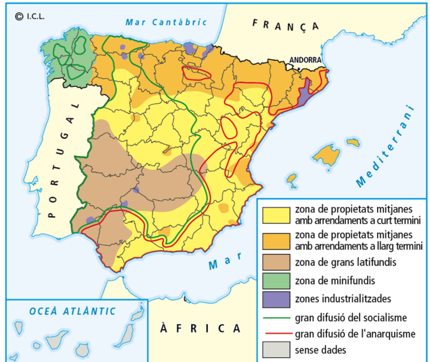
Distribució de la propietat agrària a Espanya el 1930